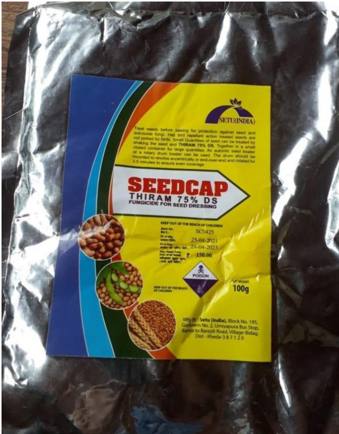
අමුණුම -6 : SEEDCAP (Thiram 75% DS) යන නමින් සඳහන් නීතිවිරෝධී විදේශීය නිෂ්පාදනය