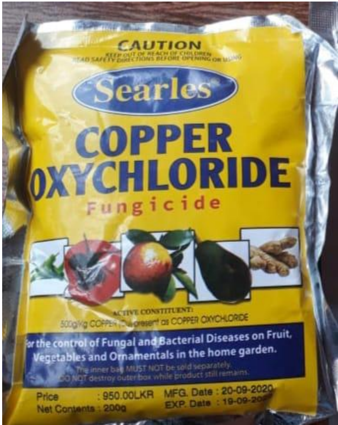
අමුණුම -9 : SEARLES COPPER OXYCHLORIDE (50% Copper WP) යන නමින් සඳහන් නීතිවිරෝධී විදේශීය නිෂ්පාදනය