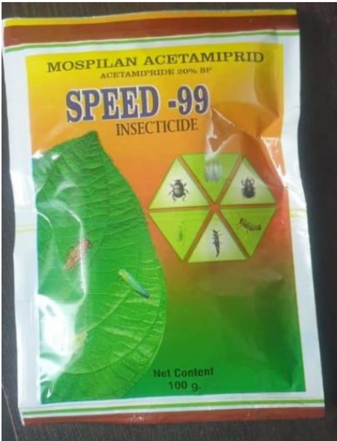
අමුණුම -7 : SPEED-99 (Acetamiprid 20% SP) යන නමින් සඳහන් නීතිවිරෝධී විදේශීය නිෂ්පාදනය