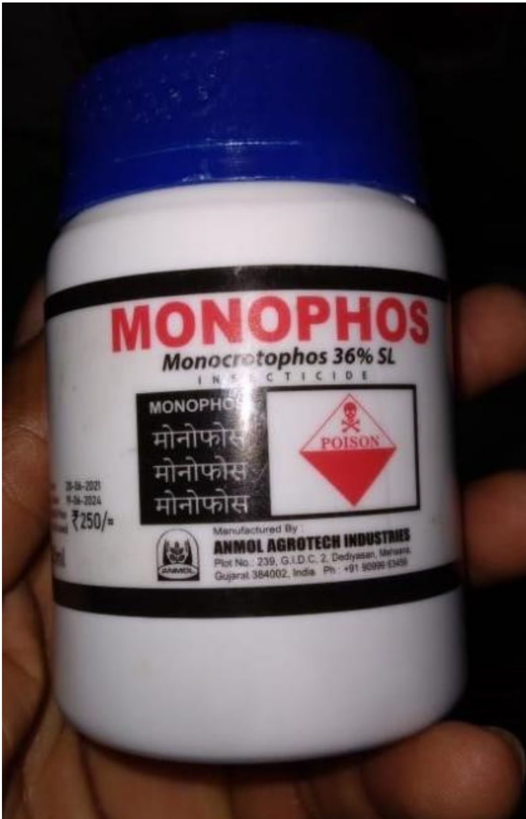
ආමුණුම -1 : MONOPHOS (Monocrotophos 36% SL) යන නමින් සඳහන් නීති විරෝධී විදේශීය නිෂ්පාදනය