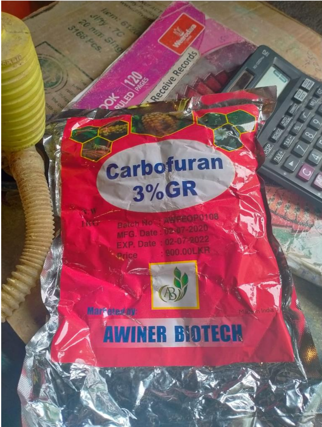
ආමුණුම -3 : Carbofuran 3% GR යන නමින් සඳහන් නීතිවිරෝධී විදේශීය නිෂ්පාදනය