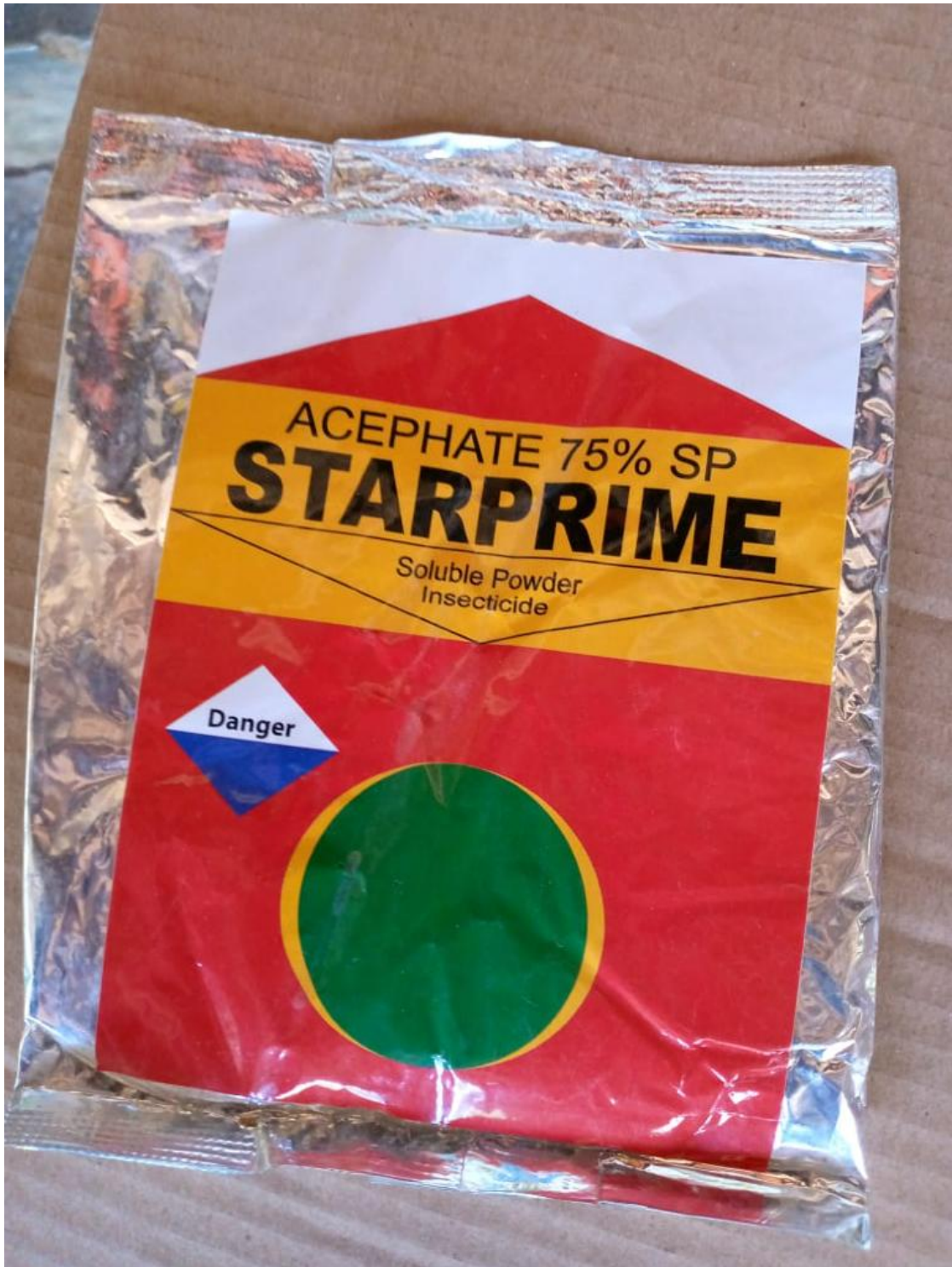
ආමුණුම -4 : STARPRIME (Acephate 75% SP) යන නමින් සඳහන් නීතිවිරෝධී විදේශීය නිෂ්පාදනය