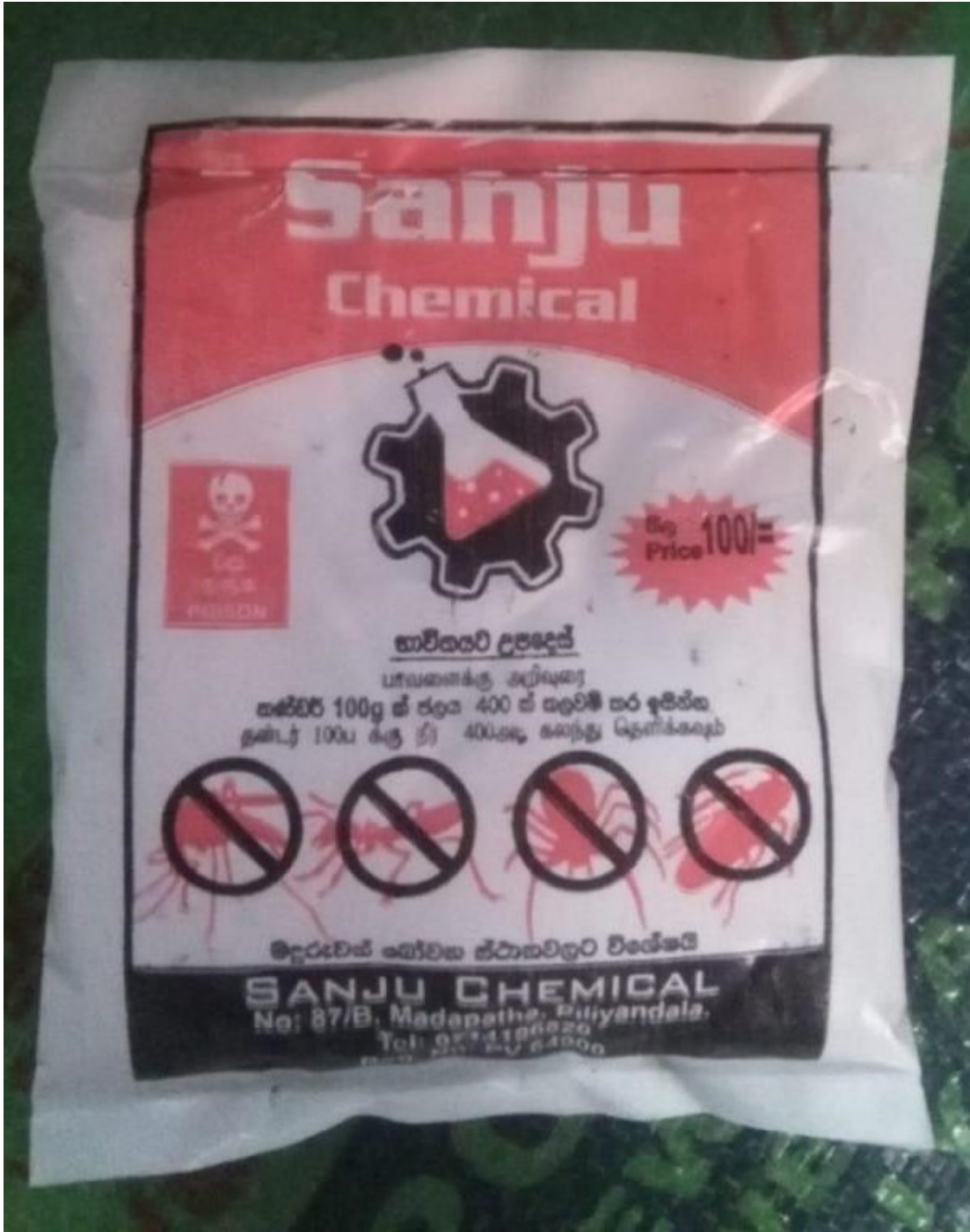
අමුණුම -8 : SANJU CHEMICAL යන නමින් සඳහන් නීතිවිරෝධී දේශීය නිෂ්පාදනය