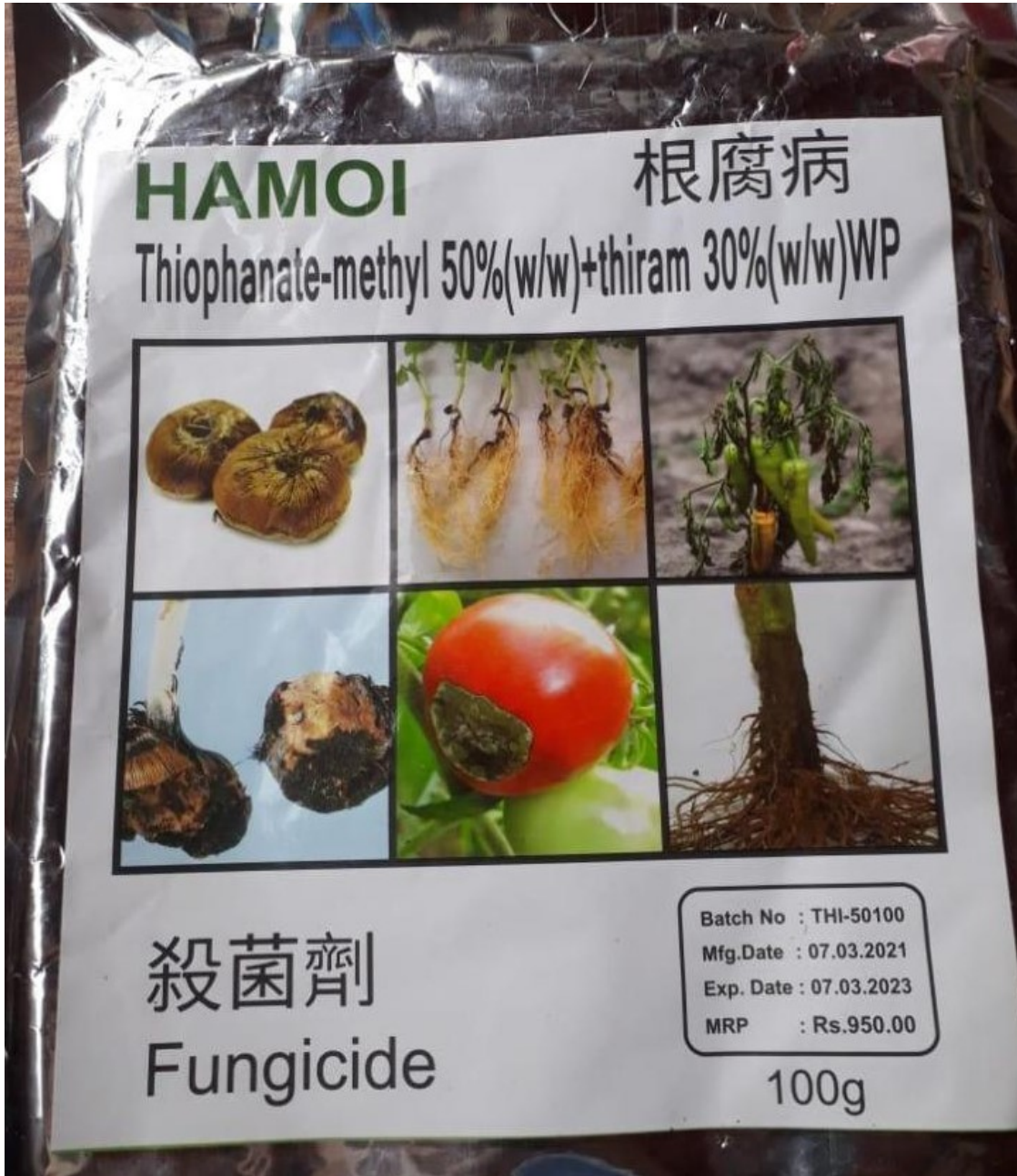
ආමුණුම -5 : HAMOI (Thiophanate-methyl 50% + Thiram 30% WP) යන නමින් සඳහන් නීතිවිරෝධී විදේශීය නිෂ්පාදනය